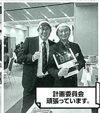
計画委員会 頑張っています。