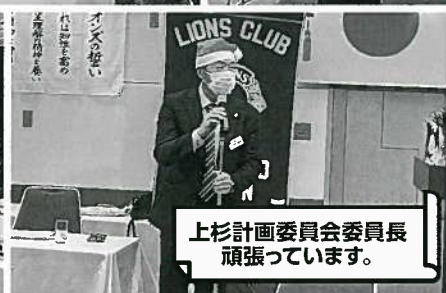
上杉計画委員会委員長 頑張っています。