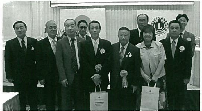
来年の富良野LC50周年の勉強をさせていただきました。