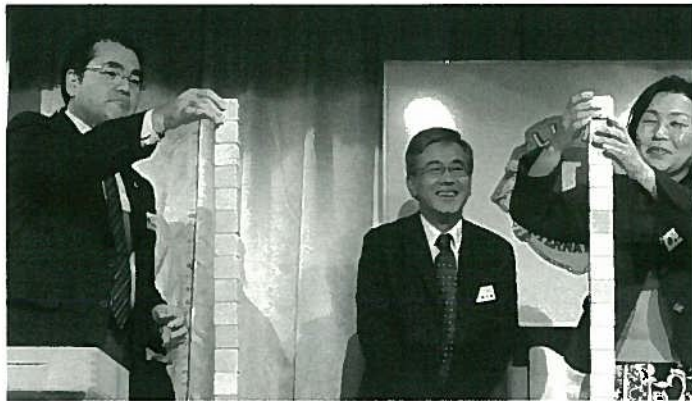
計画委員会による積み木ゲーム、かなり盛り上がりました。