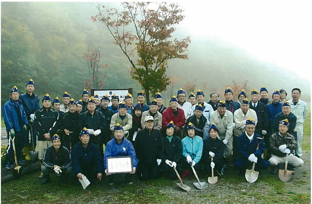
能登市長を迎えて金満緑地公園での植樹