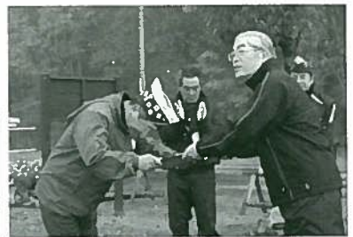
能登市長から感謝状を贈呈