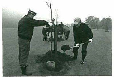
能登市長も植樹をお手伝い下さいました。