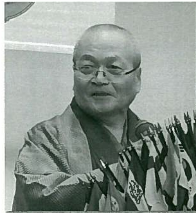
L下田コーディネーター