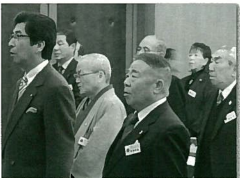
池部町長とL下田コーディネーター