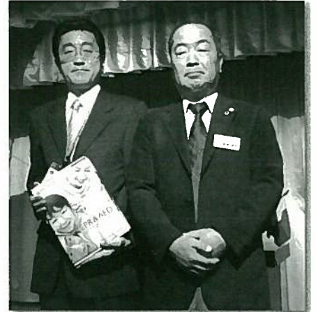
贈呈を終え、市高田学校教育課長と。