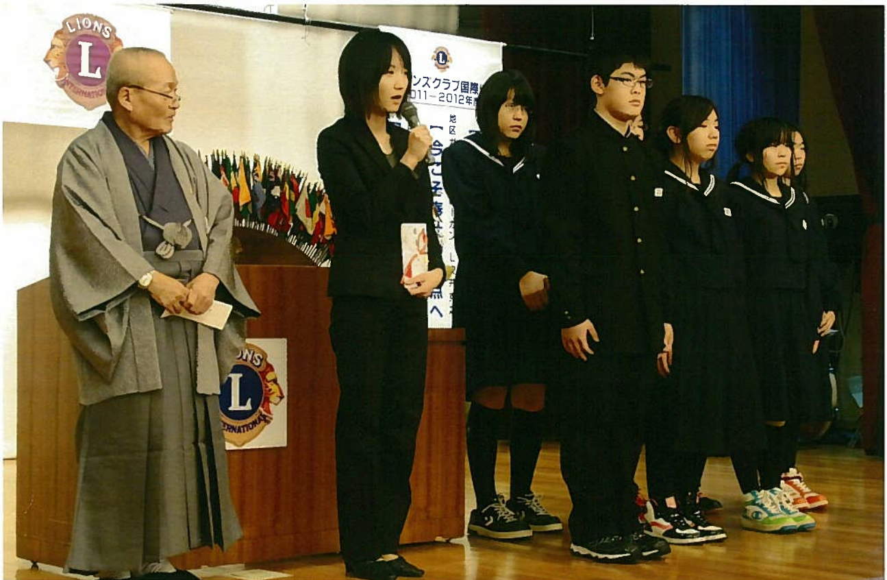
南富良野中学校吹奏楽部への楽器贈呈