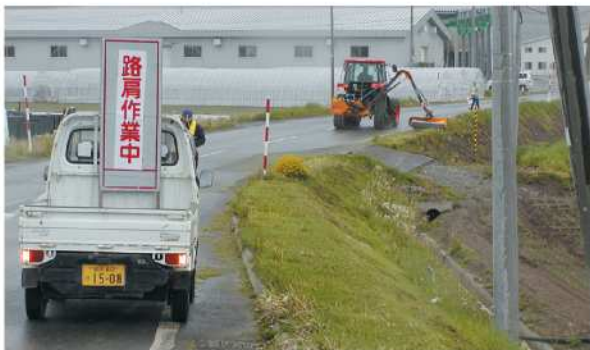
通行する車に気を遣いながら草刈りを行う (富良野中央地区環境保全会)