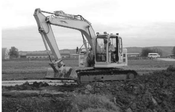
道営経営体育成事業 平原西地区 暗渠工