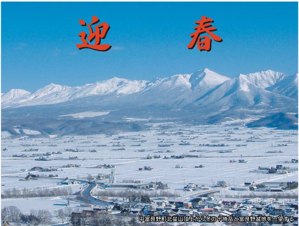
中富良野町北星山頂上から冬の十勝岳と富良野盆地を一望する