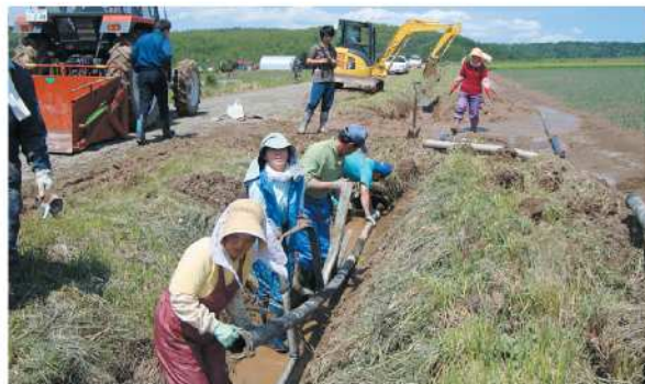
集中豪雨で排水路が埋まり、復旧作業を行う (東山地区環境保全会)