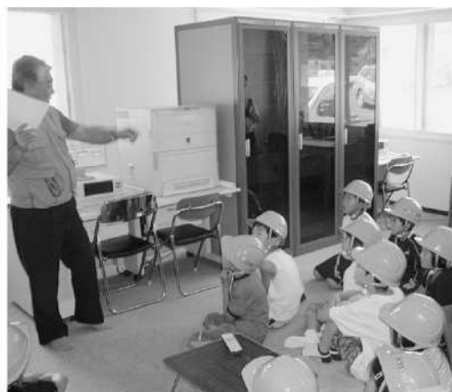
7月30日(中富良野町内の小学生・児童12人) 「夏休みの宿題スッキリ講座」 施設管理人のお話を真剣に聞く小学生