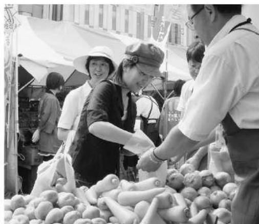
9月13・14日(札幌農産物直売フェスタ・来場者約2万人)食の安全・安心及び地産・地消をPRし、富良野の特産物を販売した。特に野菜の詰め放題は好評でした。