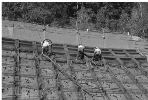
障害防止対策事業 日の出ダム改修工事 法面保護工