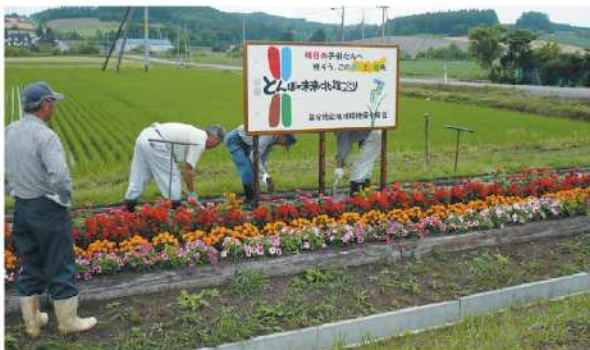
用水路の沿道に花を植栽し、道行く人の心を癒す (草分周辺地域保全会)

平成20年度の農地・水・環境保全向上対策活動状況は1市2町13組織となり、地域住民が一体となって資源保全や環境・景観を良くし、富良野の景色が何時までも美しく持続するよう努力しています。