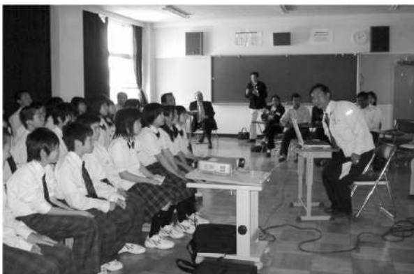
国際交流として研修生が講師となり中学生に自国を紹介する

国際交流として中富良野中学生を対象に研修生が講師となって自国を紹介する授業も行いました。また、農家訪問をさせて頂いたご家庭もあり、研修生の受入にご協力頂いたことに、この場を借りてあらためてお礼を申し上げます。言葉は通じなくても真心は通じたようです。