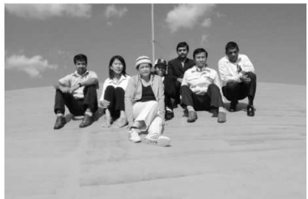
施設研修(麓郷第2ファームポンド)