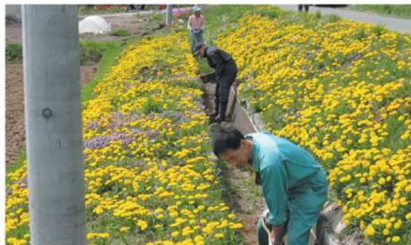
道路排水の土砂上げに精を出す (富良野北部地区環境保全会)