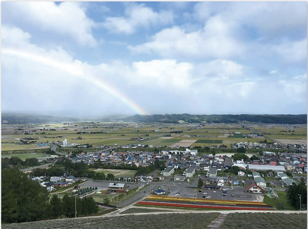
北星山から望む中富良野町(平成28年8月30日撮影)