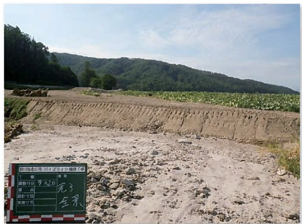
東9線北6号 パイプライン補修工事 左が着工前 右が施工後