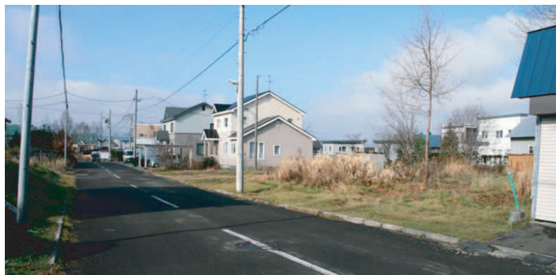
▲敷地前の8m幅員の市道