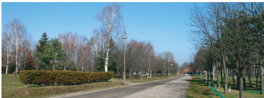
▲近くの「春光台公園」