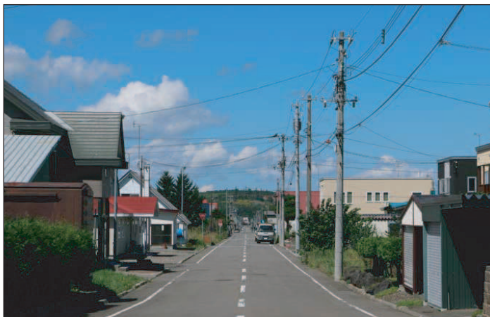
▲南東側から見た敷地前町道