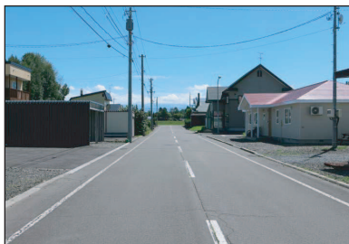
▲北西側から見た敷地前町道