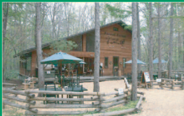
彩(いろどり)の大地館