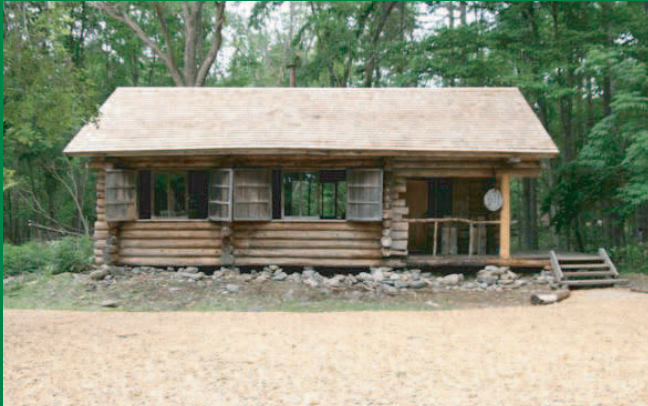
黒板五郎の丸太小屋

「森の写真館」は、富良野出身の写真家、那須野ゆたか氏のフォトギャラリーです。ショップ「彩(いろどり)の大地館」は、那須野ゆたか氏の写真集や村田鳴雪氏の書Tシャツ、葉祥明氏の丘の詩画集、かさいまりさんの絵本など、富良野のイメージをそのまま詰め込んだようなショップです。