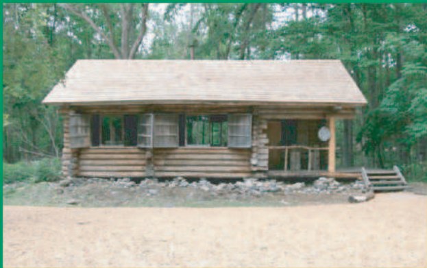
黒板五郎の丸太小屋

「森の写真館」は、富良野出身の写真家、那須野ゆたか氏のフォトギャラリーです。ショップ「彩(いろどり)の大地館」は、那須野ゆたか氏の写真集や村田鳴雪氏の書Tシャツ、葉祥明氏の丘の詩画集、かさいまりさんの絵本など、富良野のイメージをそのまま詰め込んだようなショップです。