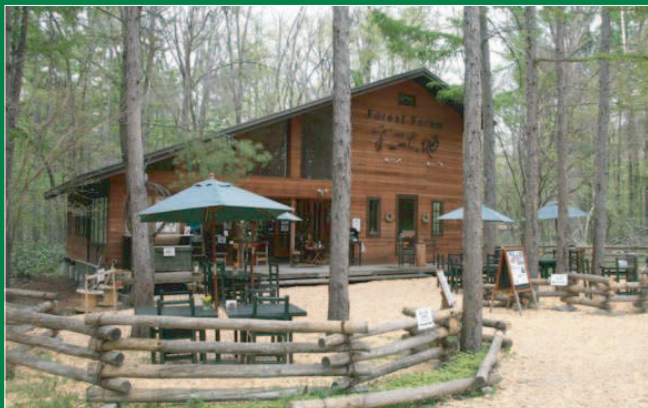
彩(いろどり)の大地館