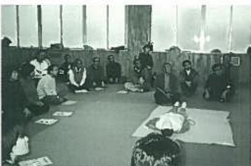
AEDの講習を熱心に聞くライオン

先輩L達が灯した1本の灯りが、42年の時を経て反射され今日、後輩Lの我々の心まで暖めてくれる。文字通り“継続は力”であります。普段我々は感謝の言葉を聞きたくてアクティビティーを行っている訳ではありませんが、44年に渡り富良野LCが行ってきた奉仕活動は声は上がらなくとも、多くの人達に感動と暖かい気持ちを与えていることを実感しました。正に1本のローソクの灯りだけでなく、暖かさにも触れる事が出来ました。AEDの講習会は我々が企画したアクティビティーでしたが、素晴らしいアクティビティーを返して頂きました。