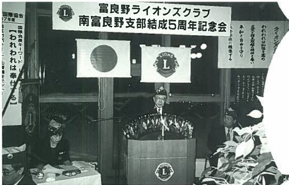
南富良野支部結成5周年記念会 12月8日 記念会席上オールドネーションを提案する名誉顧問L 田村憲行