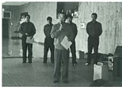
左に立っている人が山中係長です