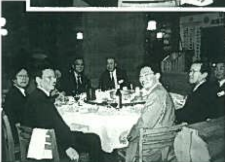
各テーブルとも笑顔がいっぱいでした