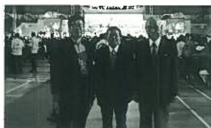
L三本松 RC、L黒田 PISAにて