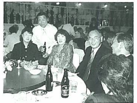
祝賀会の各テーブルの様子