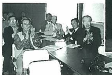
発表を聞いて拍手を送るライオン達

人は決して一人では生きていけません。素晴らしい出会いがあれば、そうでないものもあるかもしれません。でも、人間は人と関わりあって成長していくものです。気に入らないことがあったり、誰でもいいから殺してしまおうなどという短絡的な考えは捨てて、命の重さを一人一人が考え、大切にすること。これが今、私が一番伝えたいことです。