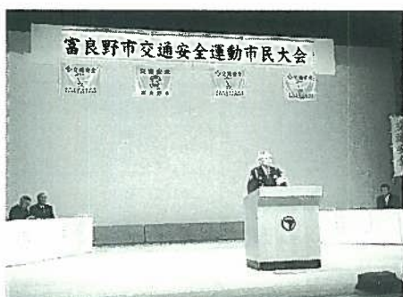
吉田警察署長の挨拶