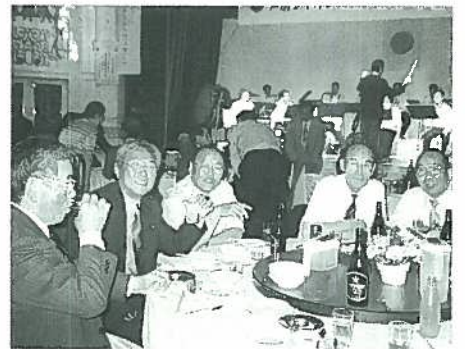
祝賀会の各テーブルの様子