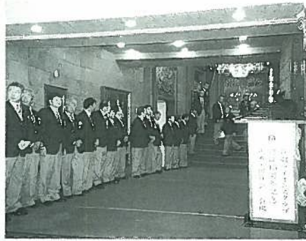
式典にお迎えする芦別L Cの皆様