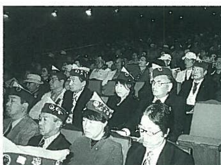
ライオンズキャップ着用で大勢参加致しました。