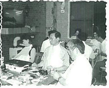
焼肉を食べながら懇親を深めます