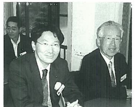
山部移動例会に出席のライオン