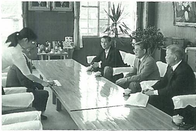
7月4日 三役で市長表敬訪問