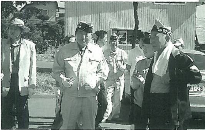
やる気満々の各ライオン