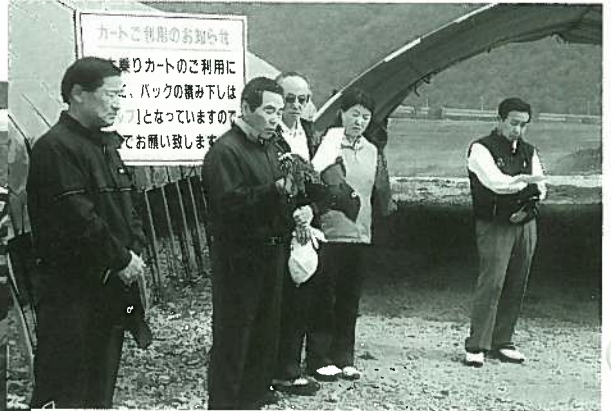
▲ゴルフ委員の各し