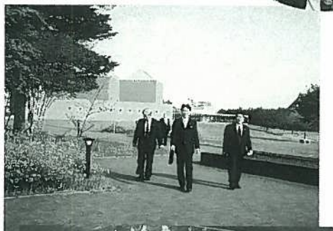
▼神田日勝記念美術館前