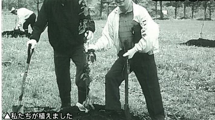
▲私たちが植えました