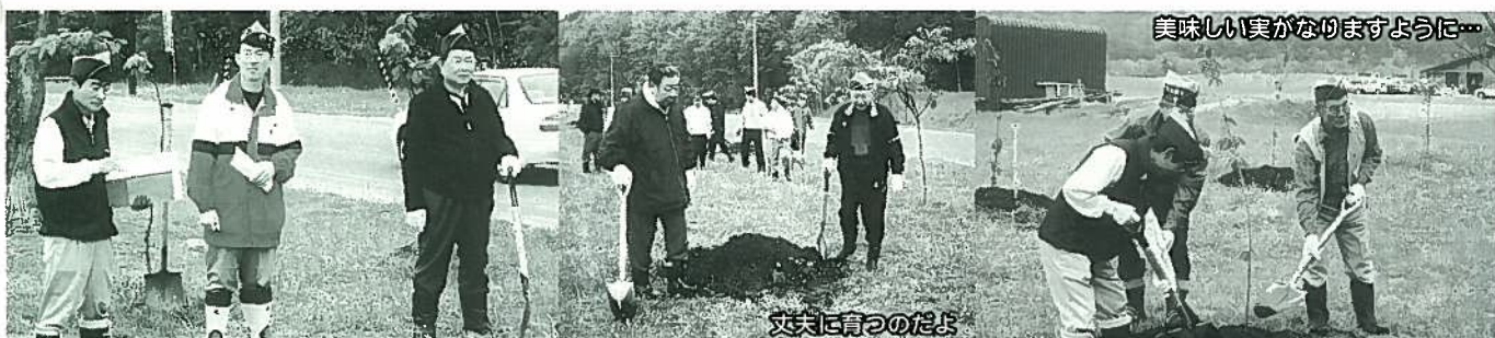
美味しい臭がなりますように...