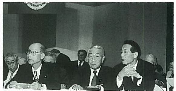
L 山崎 地区名が新刊