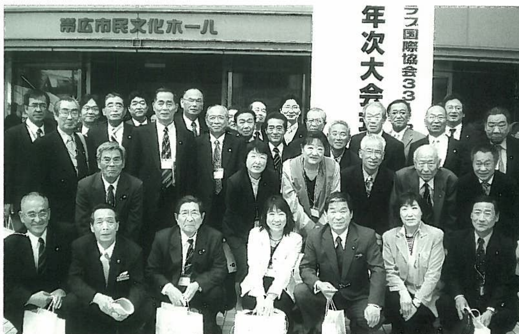
▲5月18日 第54回地区年次大会（移動例会 於：帯広市）