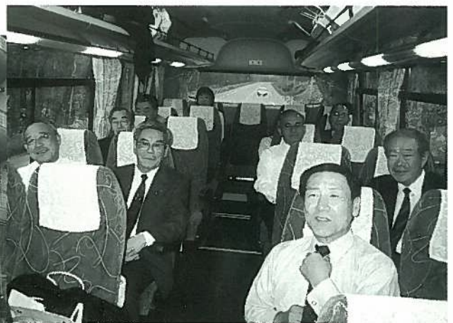
▲35名が参加しました（車中の様子）