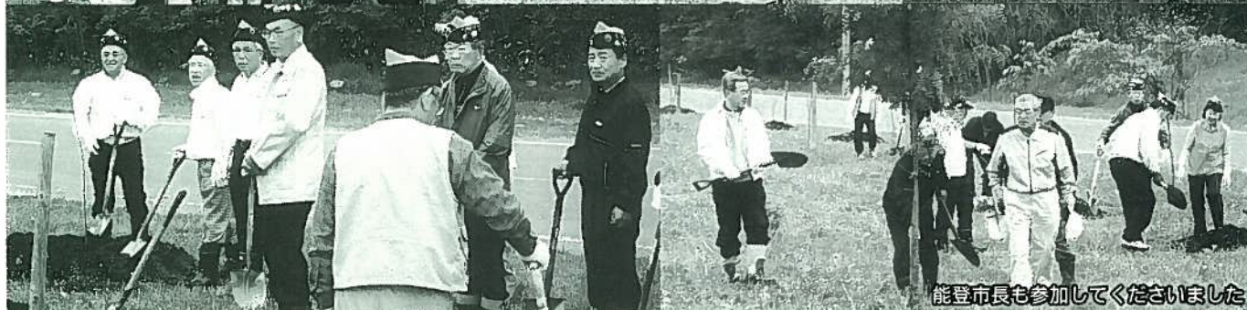
能登市長も参加してくださいました