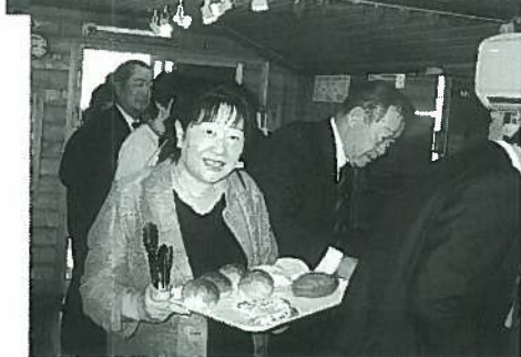
▲美味しいパン買った?