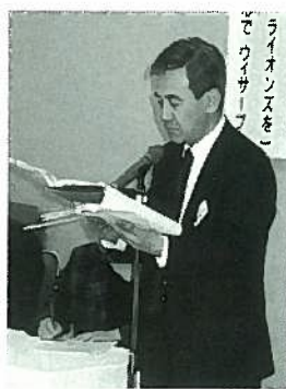
代役です、出席率報告 L 印鐘 史衛