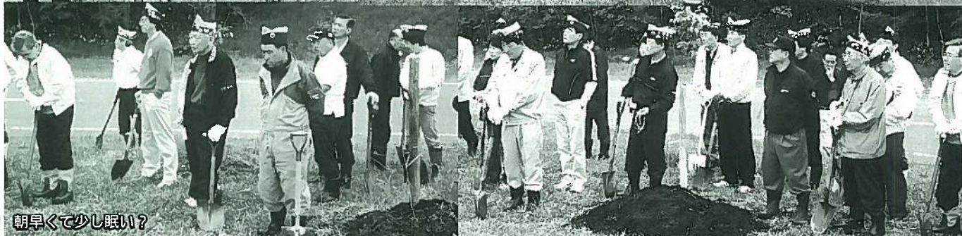
朝早くて少し眠い?