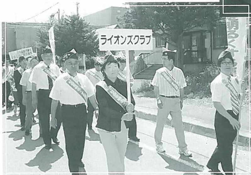
社会を明るくする運動啓発街頭パレード ライオンズクラブ会長を先頭に中心市街地を行進しました。