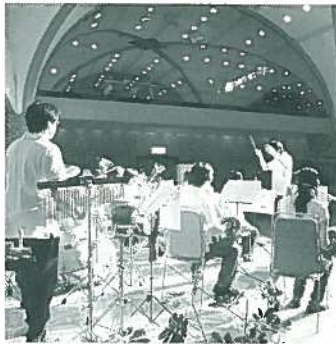
富良野吹奏楽団の演奏