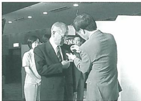
ラベルボタンの交換