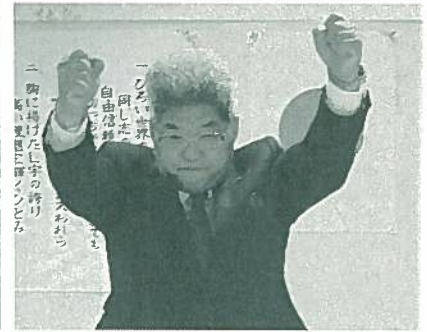
南富良野支部は日本にひとつしかない支部です