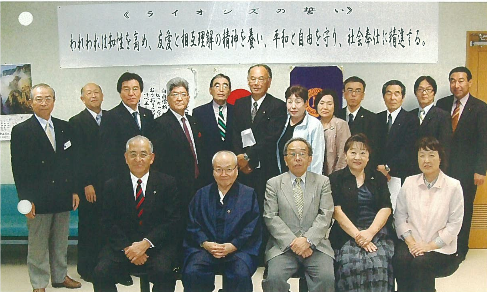
南富良野支部例会