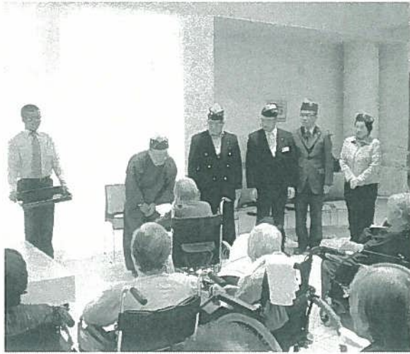
特別養護老人ホーム『ふくしあ』へ施設利用者の憩いのために、「演歌歌手DVD」3本を寄贈