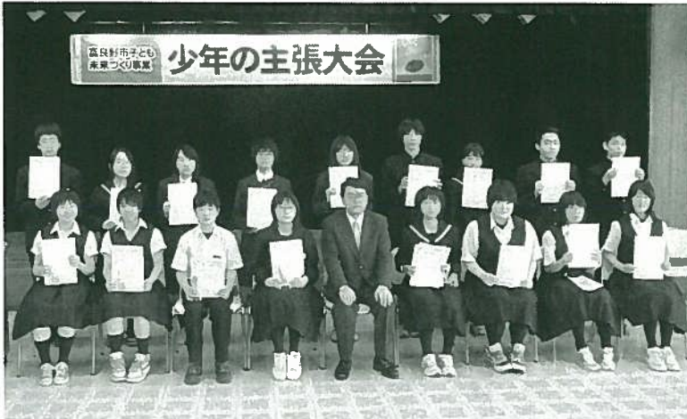
少年の主張大会に参加された皆さん