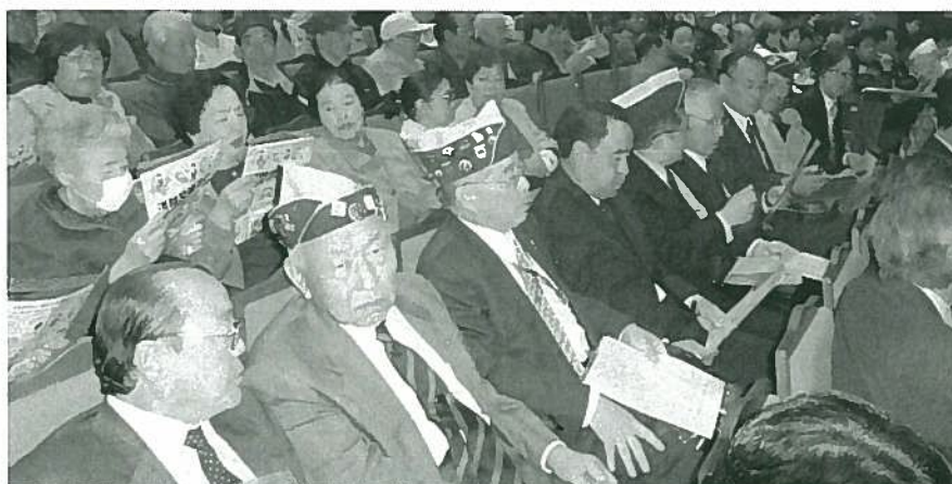
交通安全運動市民大会参加 L 労力 ACT25H