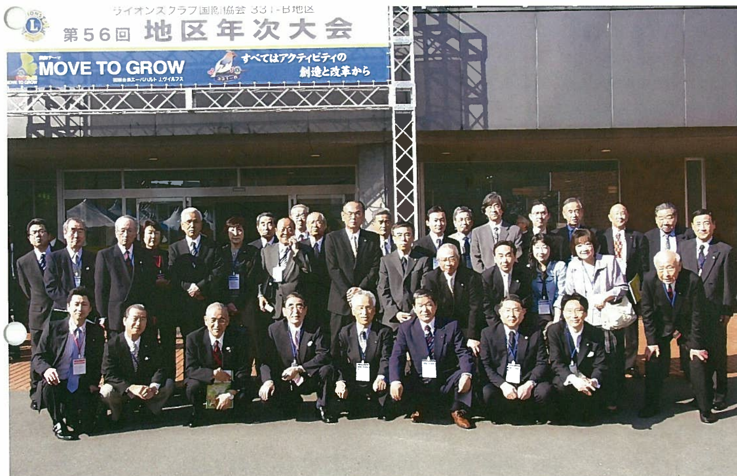
第56回地区年次大会 旭川