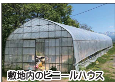
敷地内のビニールハウス