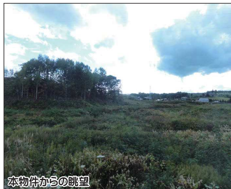
本物件からの眺望