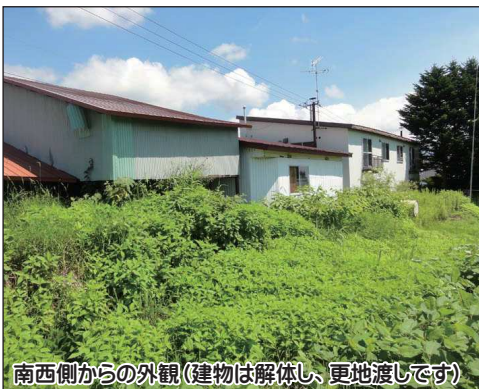
南西側からの外観 (建物は解体し、更地渡しです)