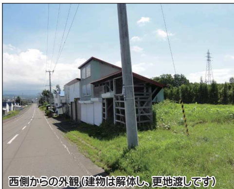
西側からの外観 (建物は解体し、更地渡しです)