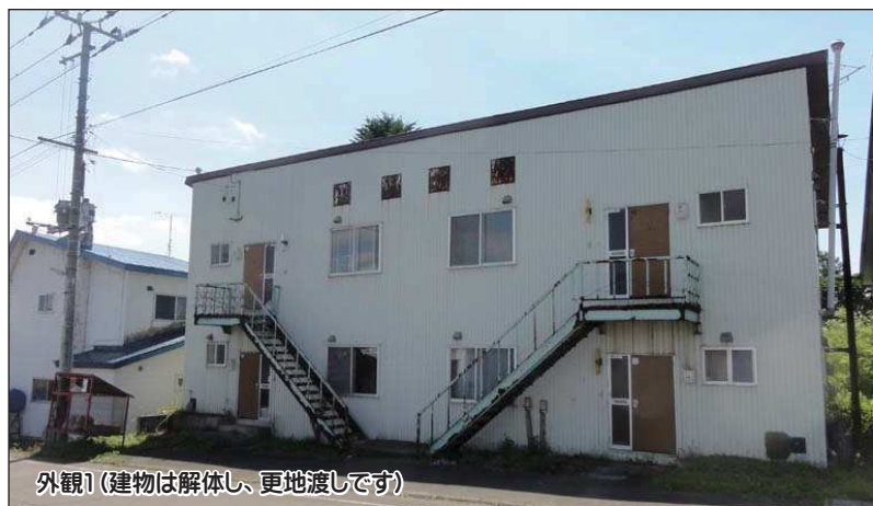
外観1 (建物は解体し、更地渡しです)