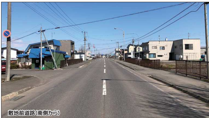
敷地前道路(南側から)