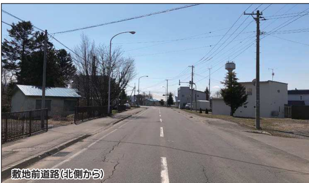
敷地前道路(北側から)