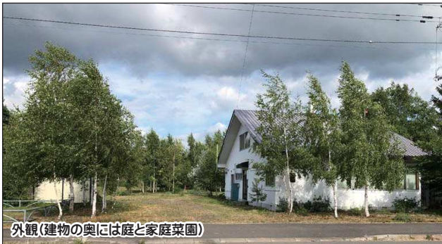
外観(建物の奥には庭と家庭菜園)