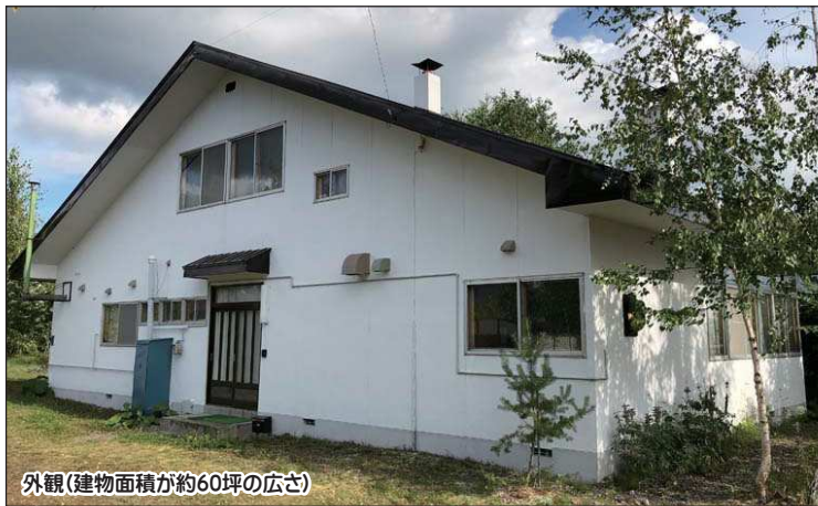
外観(建物面積が約60坪の広さ)