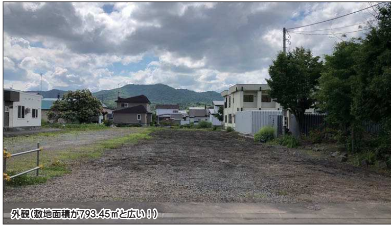
外観(敷地面積が793.45㎡と広い!)