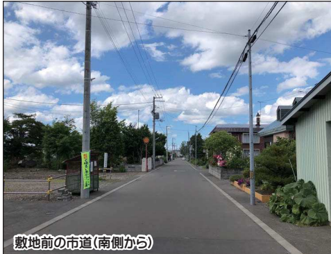
敷地前の市道(南側から)