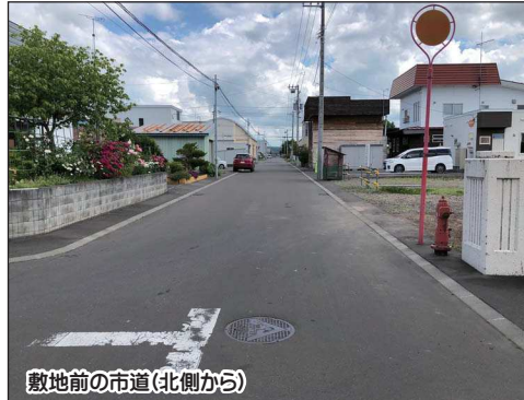
敷地前の市道(北側から)