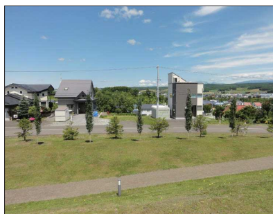
▲ 見晴台公園から見た敷地