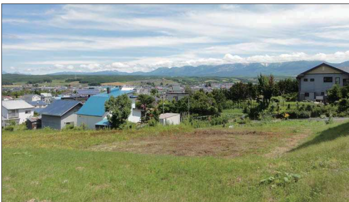
▲ 敷地から眺める十勝岳連峰