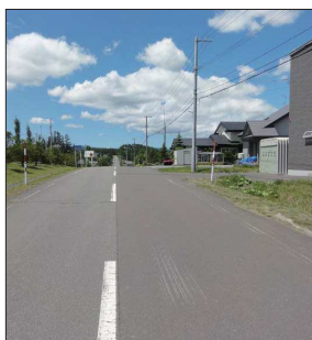
▲ 東南側から見た敷地前の町道