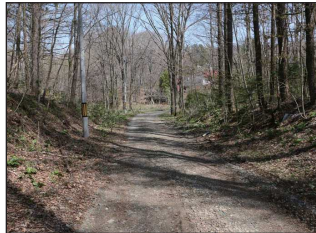
▲西側から見た敷地前の町道