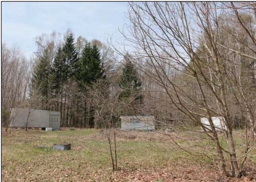
▲すぐ近くのエリア内に安平町「鹿公園」がある