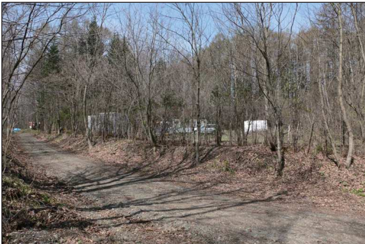
▲東側から見た敷地前の町道