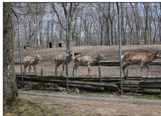
▲安平町鹿公園「エゾシカの丘」