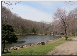
▲安平町鹿公園「ホタル池」