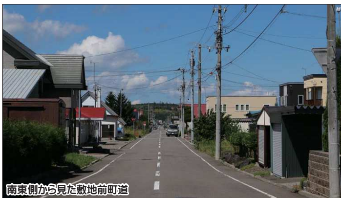
南東側から見た敷地前町道