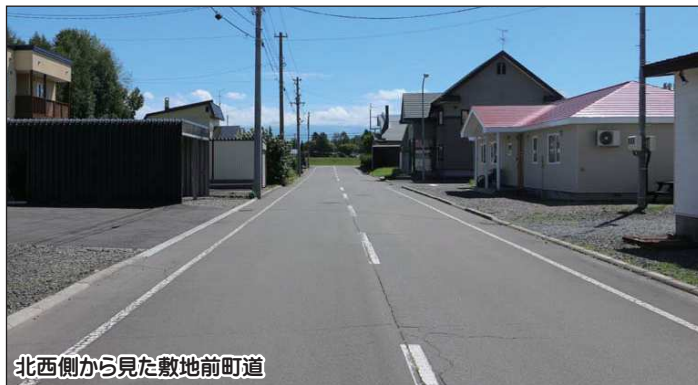
北西側から見た敷地前町道

美瑛町丸山二丁目の住宅街にあります。近くに「さくら公園」(150m)、そして「丸山公園」(400m)もあり、自然豊かな住環境です。美瑛町スポーツセンターまで400m、美瑛東小学校まで300m。