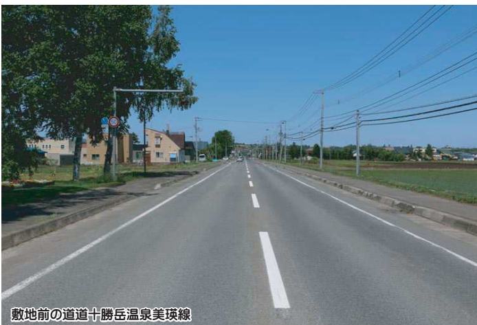
敷地前の道道十勝岳温泉美瑛線