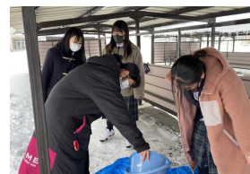
生徒会企画「アイスクャンドルづくり」