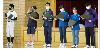
↑運営した生徒会本部役員

2・3年生とも迎える側は初体験(昨年度は中止のため)でしたが、工夫をこらしたパフォーマンスで、新1年生に楽しく学校生活や部活動について紹介していました。