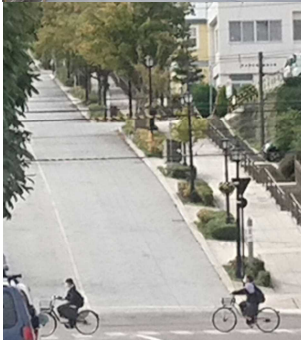
↑電動アシスト自転車で 坂の町函館を自主研修 する班もありました